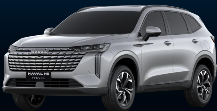
CINZA DIAMANTE (METÁLICA)