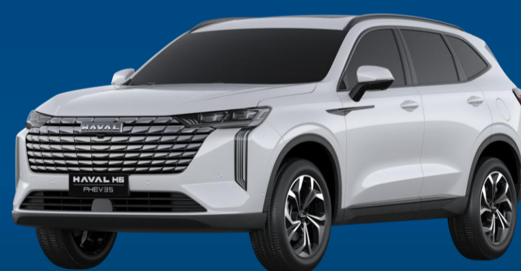
BRANCO ÁGATA (PEROLIZADO)