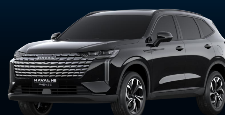
PRETO HEMATITA (METÁLICA)