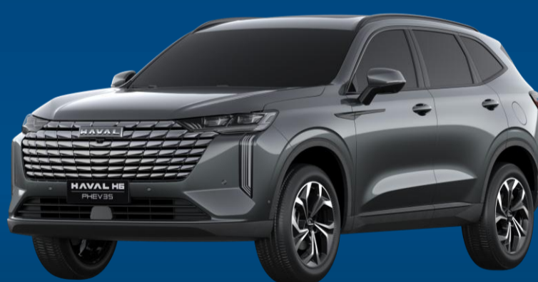
CINZA TITANIUM (METÁLICA)