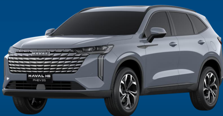
CINZA AMAZONITA (METÁLICA)