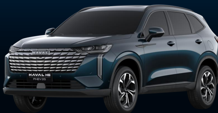
AZUL CIANITA (METÁLICA)